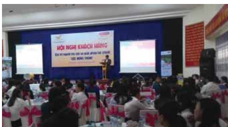
Hội thảo giới thiệu sản phẩm “Lộc Hưng Thịnh” tại tỉnh Quảng Nam đã thu hút đông đảo khách hàng đến tham dự

Vào ngày 18/1/2016, Dai-ichi Life Việt Nam đã ký kết hợp tác cùng Tổng công ty Bưu điện Việt Nam (VN Post) nhằm thực hiện cam kết đối với Khách hàng ở nông thôn, vùng sâu, vùng xa, có cơ hội được tiếp cận các sản phẩm bảo vệ và tích lũy tài chính dài lâu chất lượng Nhật Bản.