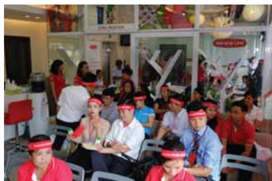
Đồng đội tình nguyện viên Dai-ichi Life Việt Nam tham gia hiến máu nhân đạo tại Văn phòng trụ sở chính

Đánh dấu cột mốc 9 năm đồng hành cùng đất nước và người dân Việt Nam (18/1/2007-18/1/2016), vào ngày 21/3/2016, Dai-ichi Life Việt Nam đã phối hợp với Hội Chữ thập đỏ Quận Phú Nhuận phát động chương trình “Vì cuộc sống tươi đẹp”- Hiến máu nhân đạo 2016 tại văn phòng trụ sở chính, số 149-151 Nguyễn Văn Trỗi, Quận Phú Nhuận, TP. Hồ Chí Minh. Hơn 400 nhân viên và tư vấn tài chính của công ty tại TP. HCM, Long An, Bình Dương và Đồng Nai đã nhiệt tình đăng ký tham gia buổi hiến máu đầu tiên này. Tổng số máu hiến tặng được trong ngày này là 338 đơn vị máu (tương đương 106.400 ml). Chương trình hiến máu nhân đạo sẽ tiếp tục được triển khai tại các tỉnh thành khác trong suốt năm 2016.